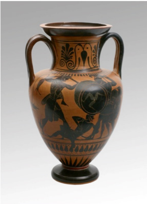
2: Herakles im Kampf mit Geryoneus/Krieger rüstet sich, Gruppe von Würzburg 230, -500, Archäologisches Museum der WWU Münster, CC BY-NC-SA.