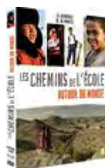
Les Chemins de l'école autour du monde , réalisé par Emmanuel Guionet, Pascal Plisson, 2015.