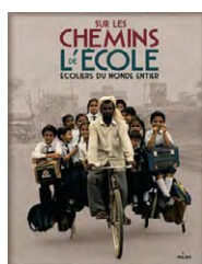
Sur les chemins de l'école , Editions Milan, septembre 2012.