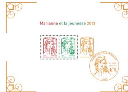
« Marianne et la jeunesse » timbres d'usage courant gamme de courrier rapide

Aujourd'hui, c'est la Marianne qui représente le timbre d'usage courant et traduit les évolutions de la société. Par exemple, les préoccupations en matière d'environnement avec la Lettre verte plus écologique, et la Lettre en ligne symbolisant la révolution numérique.