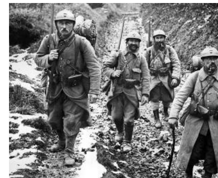
④ Grande Guerre