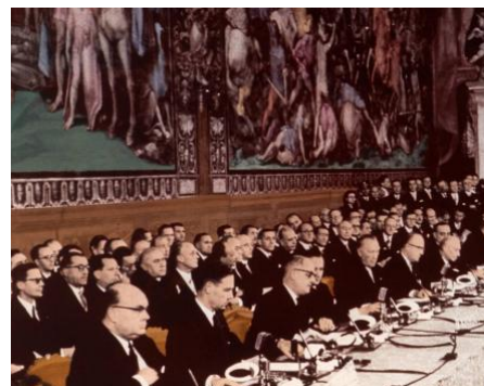
③ Traité de Rome