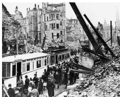
② Seconde Guerre mondiale