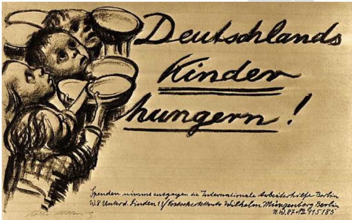
Plakat – Deutsche Kinder hungern , Käthe Kollwitz, 1923.

Es entstand 1923 im Auftrag der Internationalen Arbeiterhilfe (IAH) gegen die Nachkriegsnot in Deutschland infolge der Inflation.