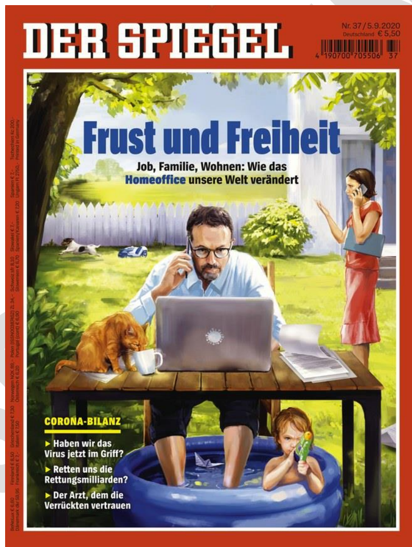
Titelseite – Spiegel – September 2020 – Frustr und Freiheit – Job, Familie, Wohnen: Wie das Homeoffice unsere Welt verändert.