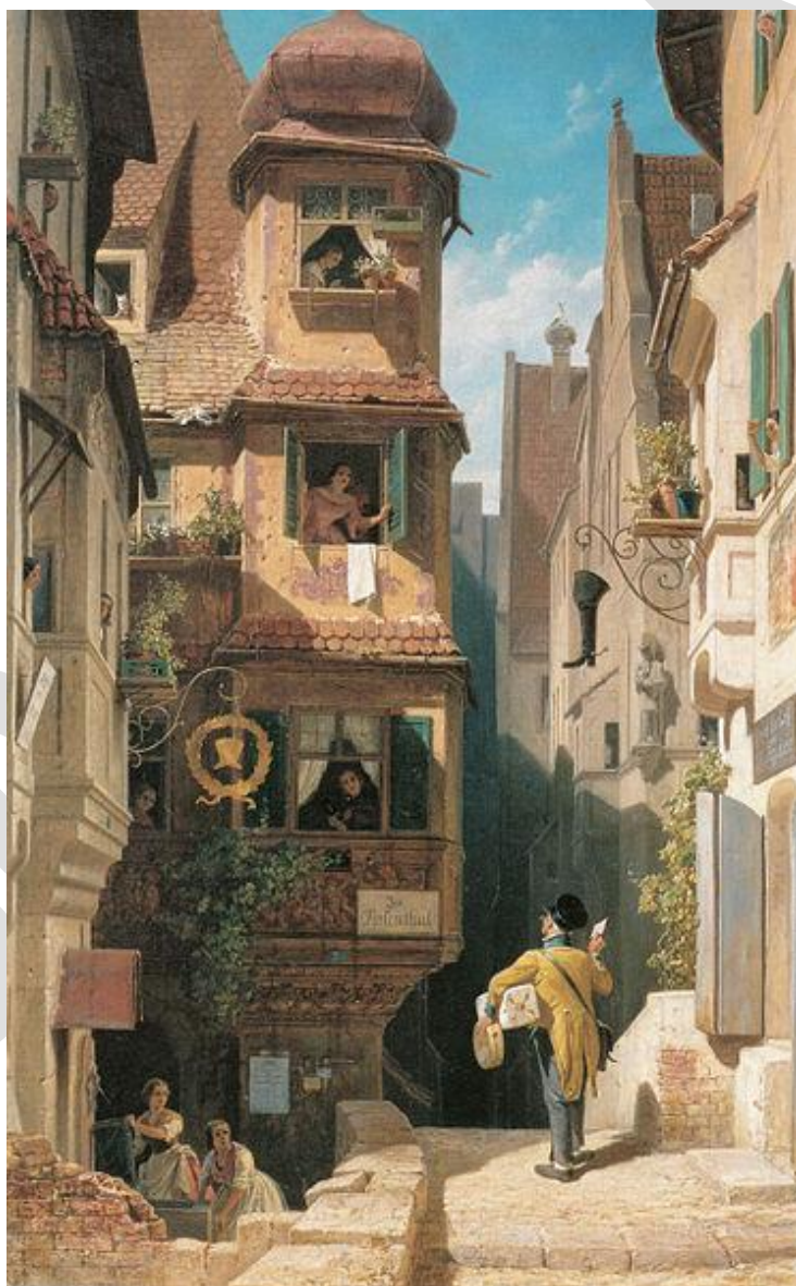
Carl Spitzweg, Der Briefbote im Rosenthal , 1858.