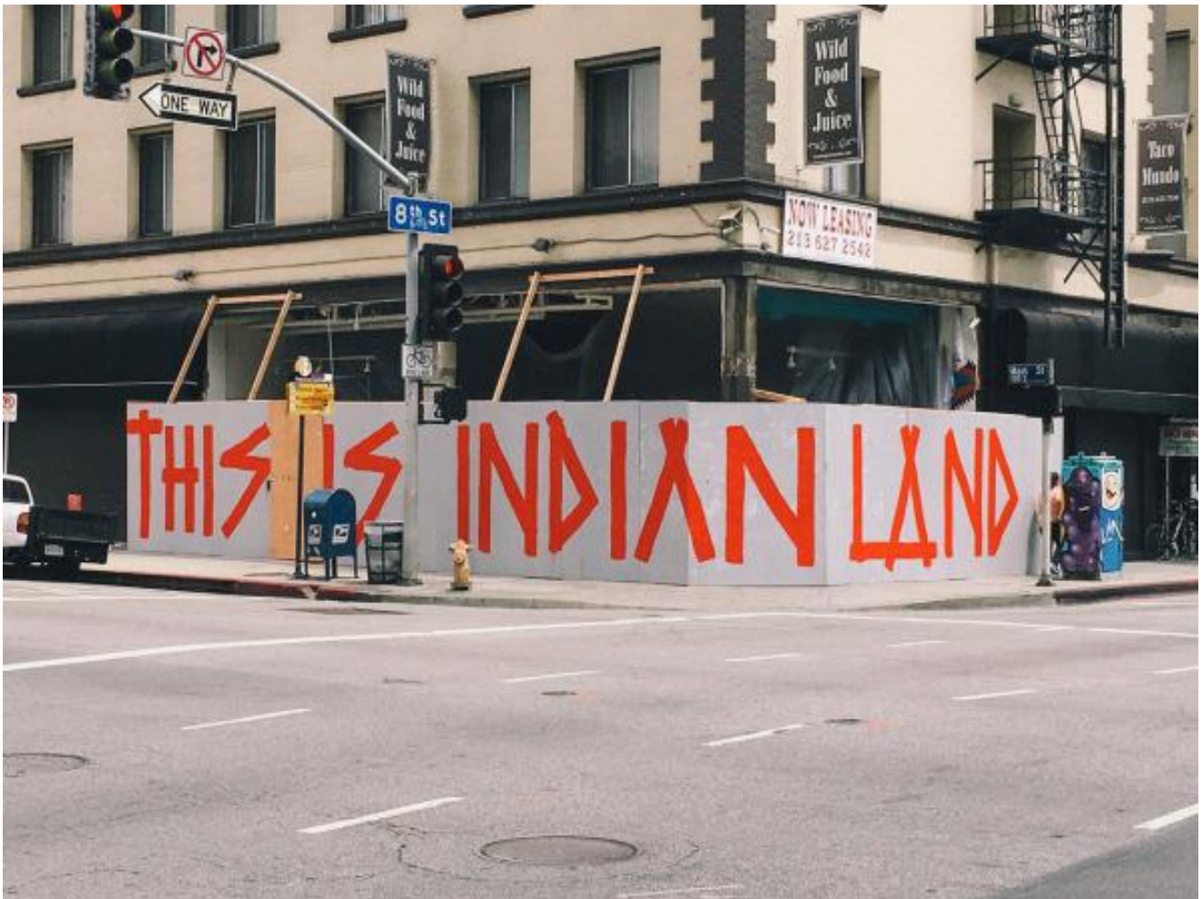
'This Is Indian Land', July 2016, temporary painting on construction wall by Native American street artist Jaque Fragua Los Angeles, corner of South Eighth Street and Main Street