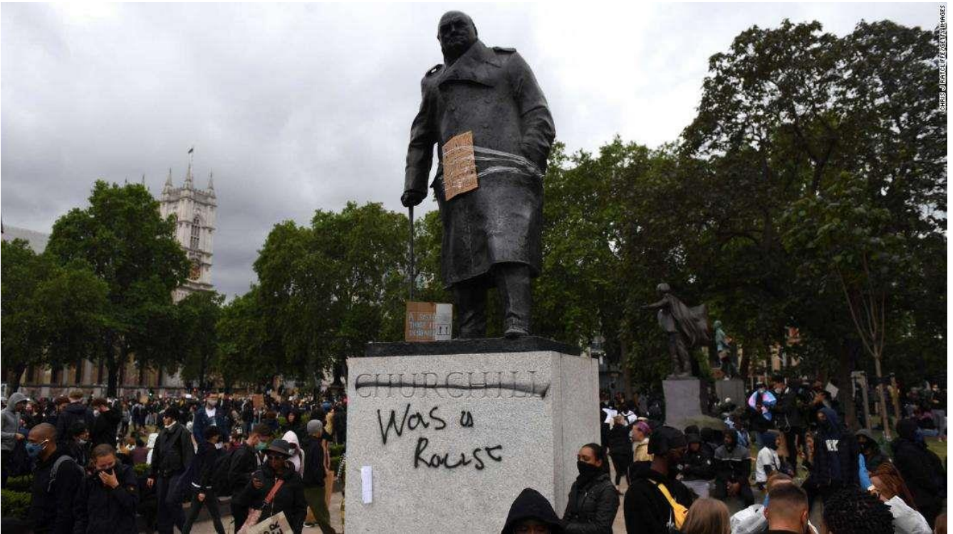
The statue of Winston Churchill in London's Parliament Square defaced during a Black Lives Matter protest on June 7, 2020