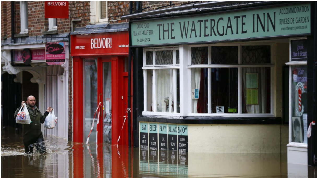
Flooding in York city centre, December 28, 2015