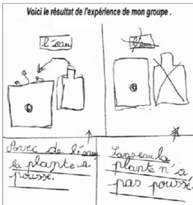
Figure 2. Exemple de représentation schématique rapportant les résultats de l'expérimentation.

Il est possible de prolonger cette expérimentation sur l'eau comme facteur nécessaire à la croissance des végétaux 4 .