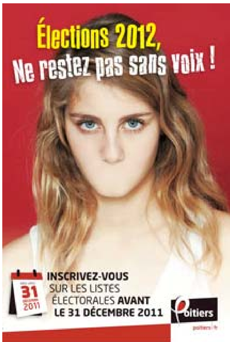
Affiche, Site internet de la ville de Poitiers, novembre 2011