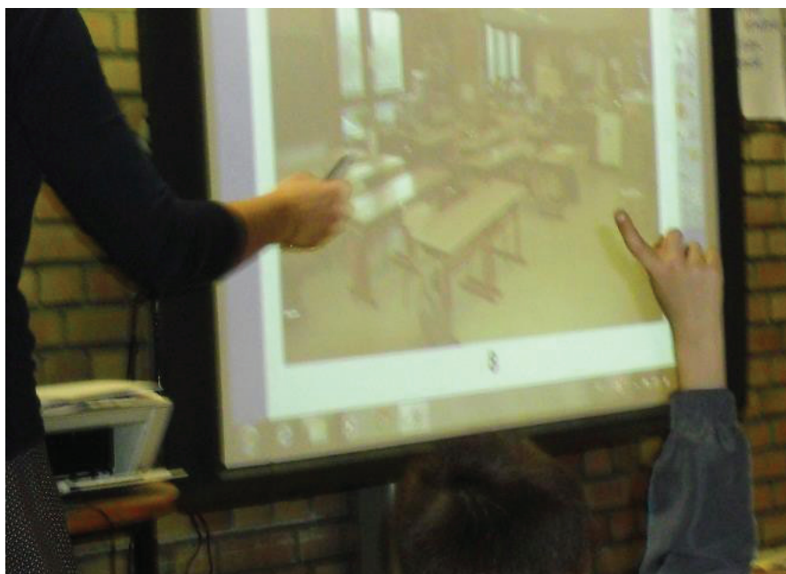
TNI – Projection des photographies

Dans un second temps, les élèves reçoivent chacun une planche de photographies de différentes classes (y compris la leur). Ils ont pour consigne de trouver celles qui ont été prises dans leur classe. Un échange a ensuite lieu sur les raisons qui permettent d'affirmer que la photographie a bien été prise dans la classe. Le but est d'amener à lister les éléments caractéristiques de celle-ci.